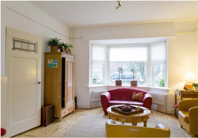
Interieur Lorentzkade in Leiden, S. Technau 2007

Uit oude archieven zijn tot nu toe weinig termen voor erkers bekend. Dat is voor historisch onderzoek erg lastig. Daarom is de Rijksdienst voor het Cultureel Erfgoed zeer geïnteresseerd in termen uit nieuw onderzoek.